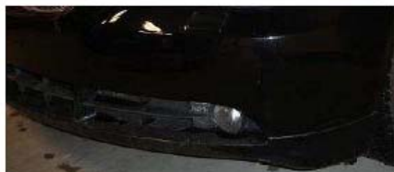
Рис. После удаления пленки на лакокрасочном покрытии не остается сколов и следов повреждения.